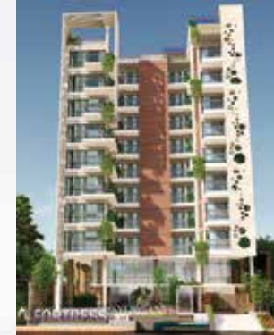
Fortress Syngenis Park