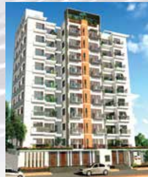
Fortress Light House