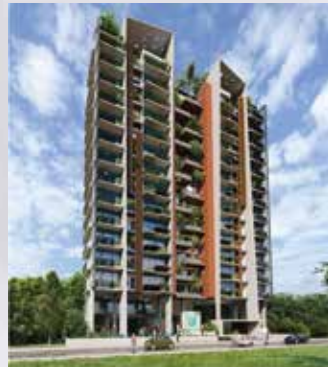
Fortress Crystal Park